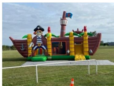
Le bateau pirate

Temps bien maussade pour ce vide grenier ! Quelques vendeurs ne sont pas venus par crainte de la pluie qui n'est pourtant arrivée que vers 15 heures. De nombreux chineurs étaient présents en matinée.