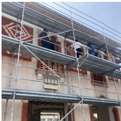
Réunion de chantier sur la pose des menuiseries extérieures et la problématique des briques déjà en place