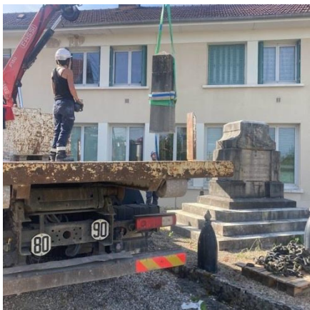
L'obélisque dans les airs