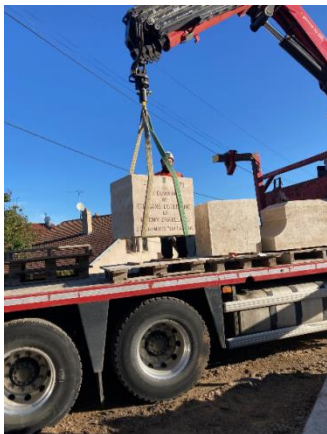
Repose des éléments