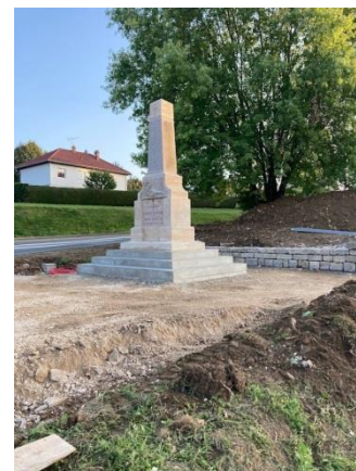
Un aperçu du nouveau monument