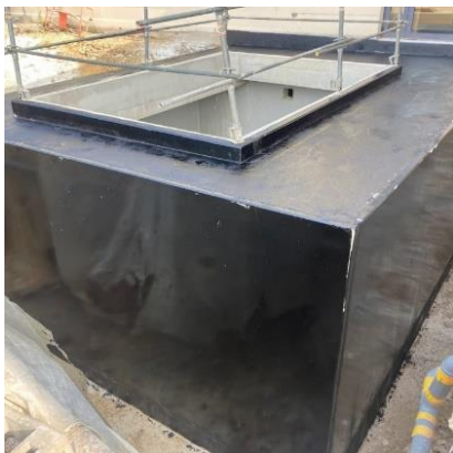
Etanchéité du silo à plaquettes

Quelques photos de cette période juin /juillet/août