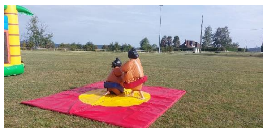
Un combat de SUMOS

Un bel après-midi rempli de rires et de jeux.